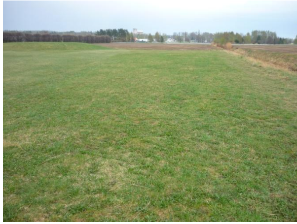
Vy över området sett norrifrån (väster om koloniområdet)