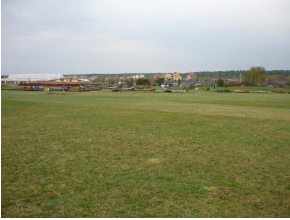
Vy över området sett söderifrån (vid åkerkanten)