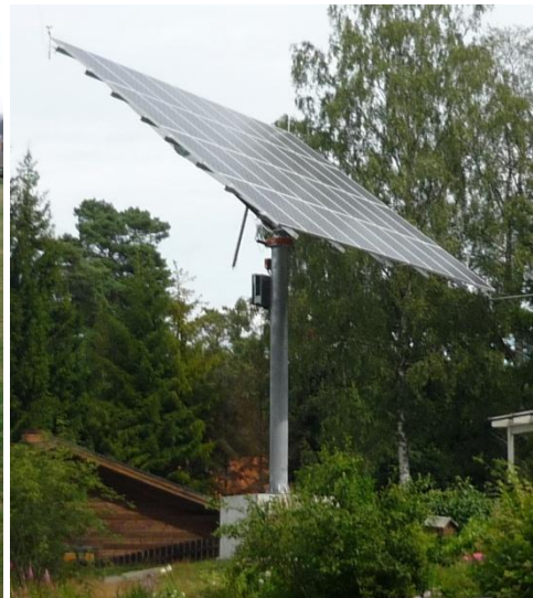
Solföljare (finns i Skogsbo, Enköpings kommun)