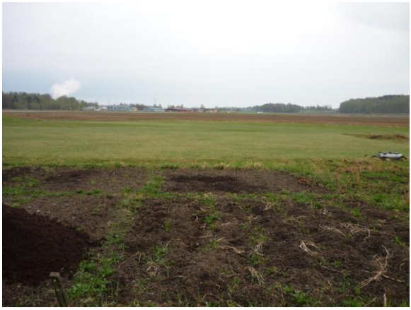
Vy över området sett från nordost (koloniområdet)