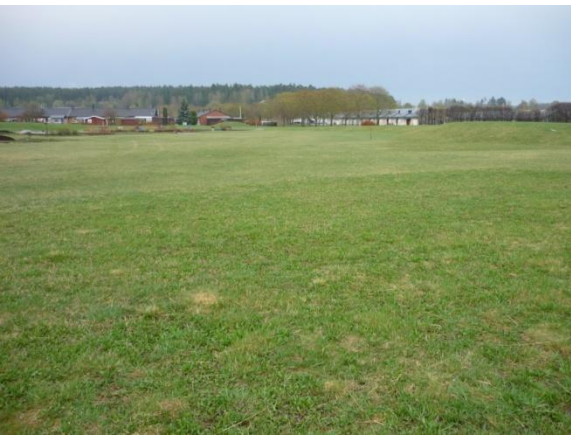
Vy över området sett västerifrån (vid diket)