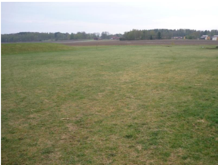
Vy sedd österifrån (Skeppsvägen)