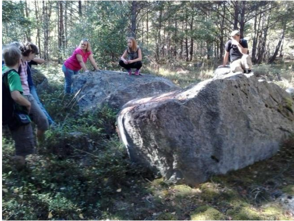
Bautastenar på Prästbergets topp