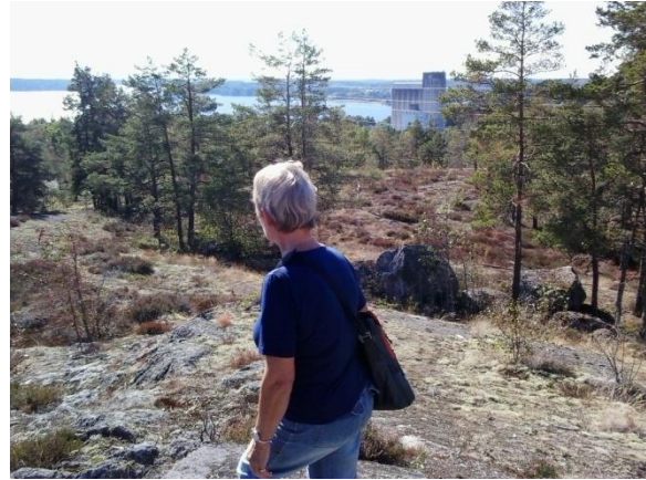
Här uppe på Prästbergets topp brann vårdkassen i orostider