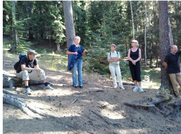
Bland 200-åriga tallar vid Lillsjöns strand

Vid dessa platser förrättade människorna under brons- och stenåldern offer (oftast i form av husdjur) till gudar eller andra makter man trodde på. Namnet Draget har också en förhistorisk klang. Fram till slutet av järnåldern var farleden väster om Skohalvön mellan Björkfjärden och Uppsala ännu farbar med båt men över grusåsen mellan Lillsjön och Kalmarsandsfjärden blev man tvungna att dra sina skepp över land m.h.a. stockar, därav namnet Draget. Vid Lillsjön finns också unika fornminnen i form av s.k. hålvägar. Öster om Lillsjön löper i nord-sydlig riktning en 1700-talsväg. Från denna och ned mot Lillsjön löper några vägar, ibland ordentligt nedgrävda i grusåsen. Ingrid tror att dessa hålvägar uppstått genom att människor systematiskt använt dessa för att kunna komma ned med sin häst för att dricka av Lillsjöns vatten.