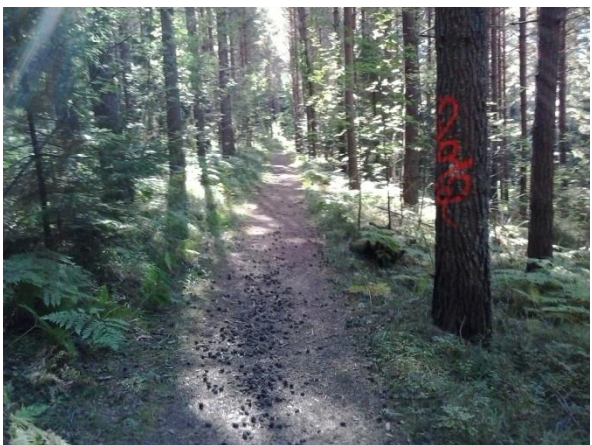
1700-talsvägen som löper parallellt med Lillsjön